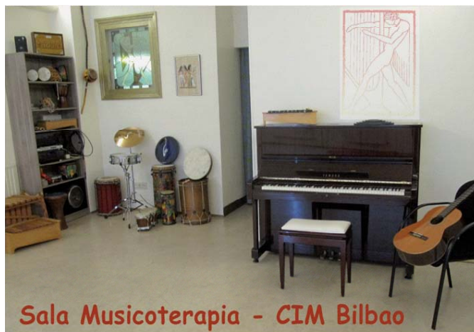
Sala Musicoterapia - CIM Bilbao

- Pago aplazado: 5 mensualidades de 545 € en los Seminarios 1 - 3 - 5 - 7 y 9.